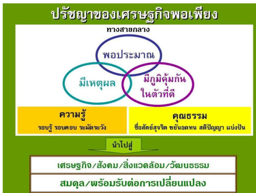
ภาพที่ 1 ปรัชญาเศรษฐกิจพอเพียง 3 ห่วง 2 เงื่อนไข ที่มา : โครงการเศรษฐกิจพอเพียงและเกษตรทฤษฎีใหม่, 2555

ดังจะเห็นภาพรวมของคำนิยาม 5 ที่มี 3 คุณลักษณะ ควบคู่ไปกับ 2 เงื่อนไข ดังภาพที่ 1